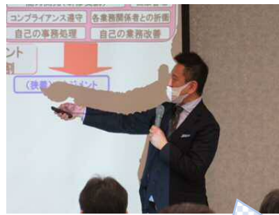
熱血講師 (大軽先生)