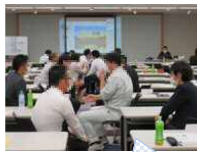
ペアワークの様子