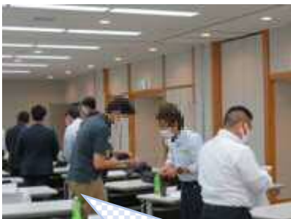
受講者同士の交流～名刺交換～