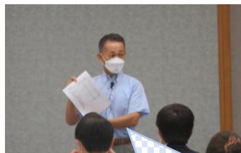
ベストセラー 「財務3表一体理解」 の著書 (國貞講師)