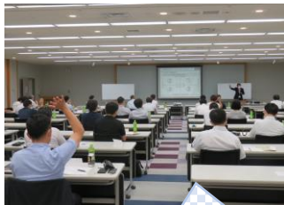
ソーシャルスタイル診断 結果共有