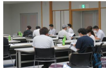
グループワーク中