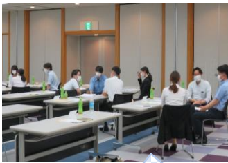
グループワーク中