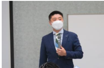
熱血人気講師 (北講師)