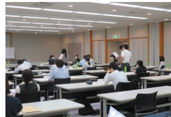
ワーク内容の発表