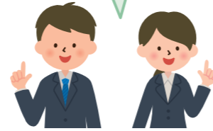
2024年度受講者アンケートより

異業種の方との意見交換 や悩みの共有により、 新たな視点や気付きを 得られた。 (卸売業)