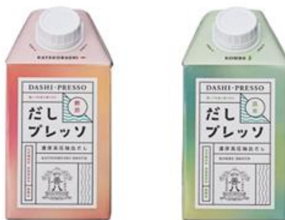
▲写真 FSC認証紙をラベルに使用（株）マルハチ村松

※C o C認証：Chain of Custody の略で非認証の水産物の混入を防ぐとともに、製品がたどってきた経路を遡ることができるようトレーサビリティを確保するための仕組み。