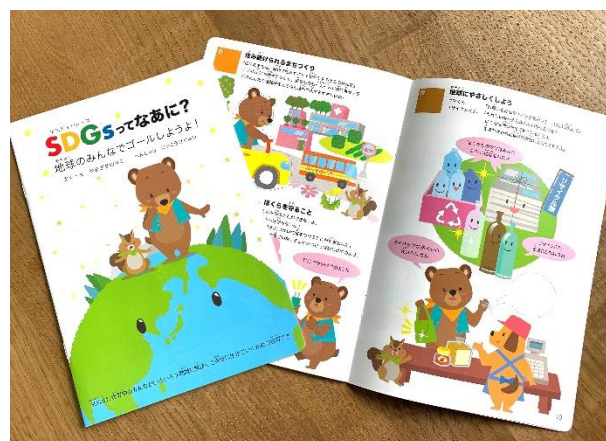
▲写真 SDGsのシール絵本(日興美術(株))

※FSC認証: 持続可能な森林活用・保全を目的として誕生した、「適切な森林管理」を認証する国際的な制度