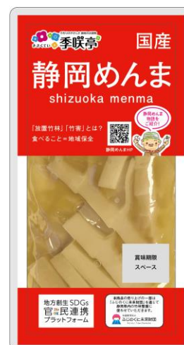
▲写真 放置竹林の幼竹を加工した静岡めんま（株季咲亭）

「放置竹林の資源化を目指すこのプロジェクトは始まったばかりで、多くの方に応援してもらいたい。そのためにはSDGsが一つのきっかけになる」（小泉幸雄社長）と期待を込めている。