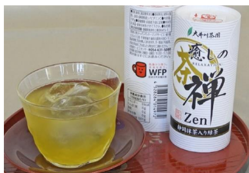
▲写真 カートカンを使用した緑茶飲料(株)大井川茶園

※レッドカップキャンペーン：国連世界食糧計画(WFP)が運営するキャンペーンで、キャンペーンマークのついた商品を購入すると、その売上の一部が、企業から寄付される。WFPは2020年ノーベル平和賞を受賞。