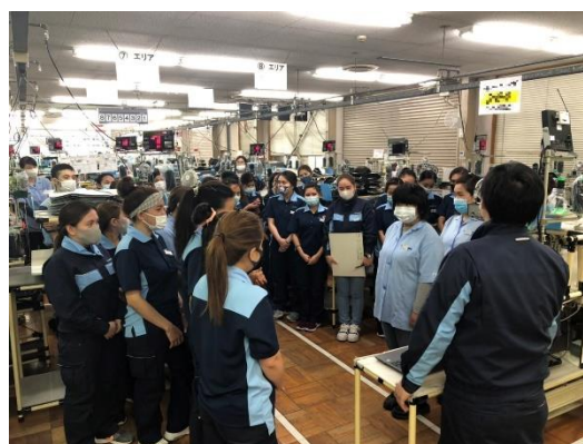
▲写真2 時間をかけた朝礼（平野ビニール工業(株)）

※ ポジティブ・インパクト・ファイナンス：SDGsに資する事業活動を行っている企業に対する投融資。金融機関は取引先企業の事業活動を評価し、環境、社会、経済に対するプラスの影響（ポジティブ・インパクト）と、マイナスの影響（ネガティブ・インパクト）を特定、目標を設定した上で、モニタリングしながら達成を支援する融資商品。